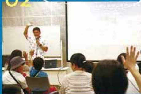
海の先生特別授業