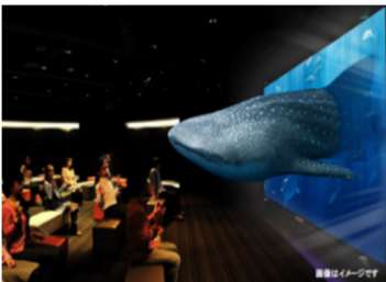
▲3D Okinawa Churaumi Aquarium & 3D 沖縄海中散歩