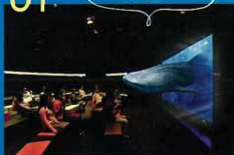
3D Okinawa Churaumi Aquarium & 3D 沖縄海中散歩