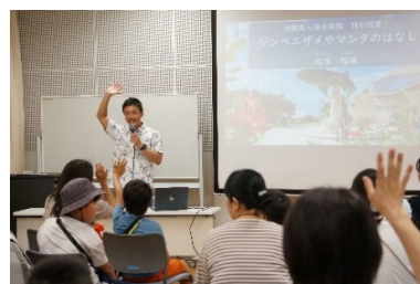
▲海の先生特別授業