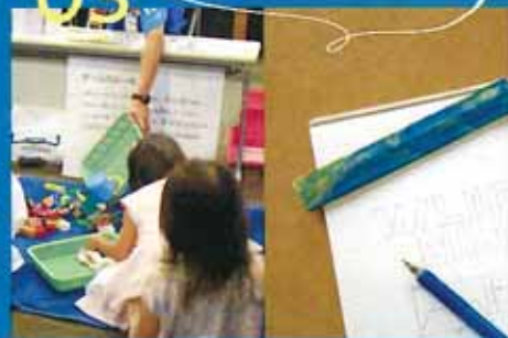
10/4 プラごみ分別! 重さ当てゲーム 10/5 カラフルキャップ大変身! アップサイクル体験