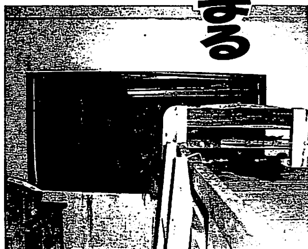
C：子供部屋の窓から流れ込んだ土砂 (右手前、二段ベット)