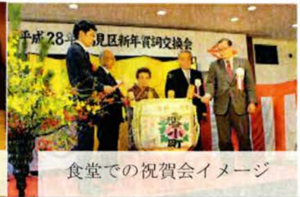
食堂での祝賀会イメージ